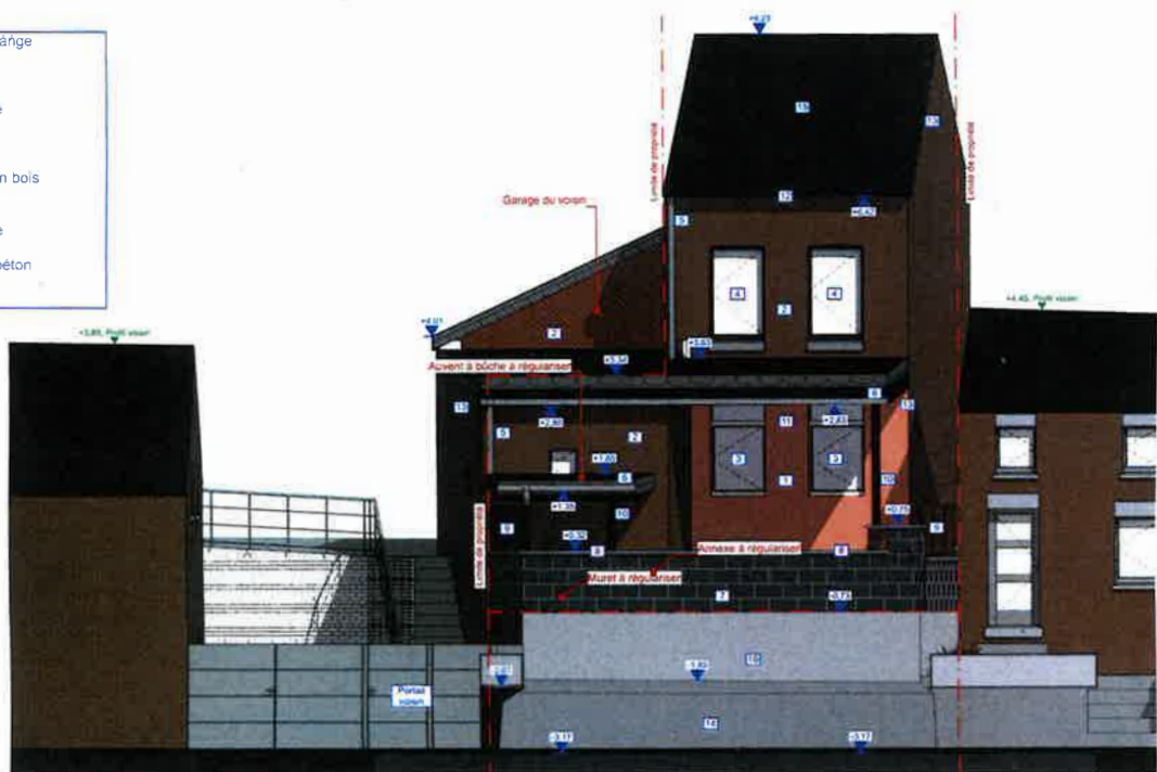
Façade Arrière - Murets de soutènement à régulariser